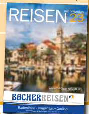
Preise pro Person im Doppelzimmer. Es gelten die Allgemeinen Reisebedingungen von Bacher Reisen.